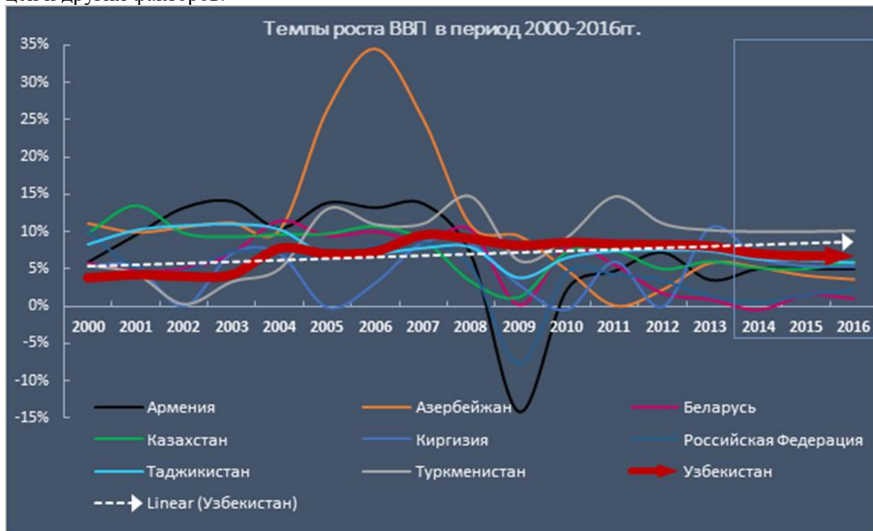
График 1. Темпы роста ВВП в период 2000-2016гг.

доходных групп». При этом характер перераспределения национального богатства таков, что происходит не укрепление, а, наоборот, размывание и сокращение среднего слоя. Чтобы выявить степень дифференциации доходов, бедности в стране необходимо четко определить качественные и количественные показатели уровня доходов населения, который постоянно меняется под воздействием развития производительных сил и производственных отношений, изменения общего уровня жизни, потребностей населения, цен и других факторов.